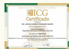
Certificado del Curso